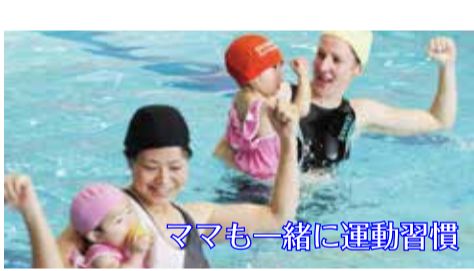
ママも一緒に運動習慣

ママもしっかり運動したいですね。赤ちゃんを抱っこしながら一緒に楽しむプログラムです。 ※お子様の耳鼻科診断書をご持参ください。