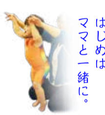
ママはじめは一緒に。

はじめはママと一緒にリズム体操。それからお友達とプールトライ。 ※満5歳からはクラス変更していただけます。 ※3歳以下のお子様は耳鼻科診断書を持参ください。 夏入会お子様プレゼント ▶ 水着・キャップ・バッグ ※8月8日まで